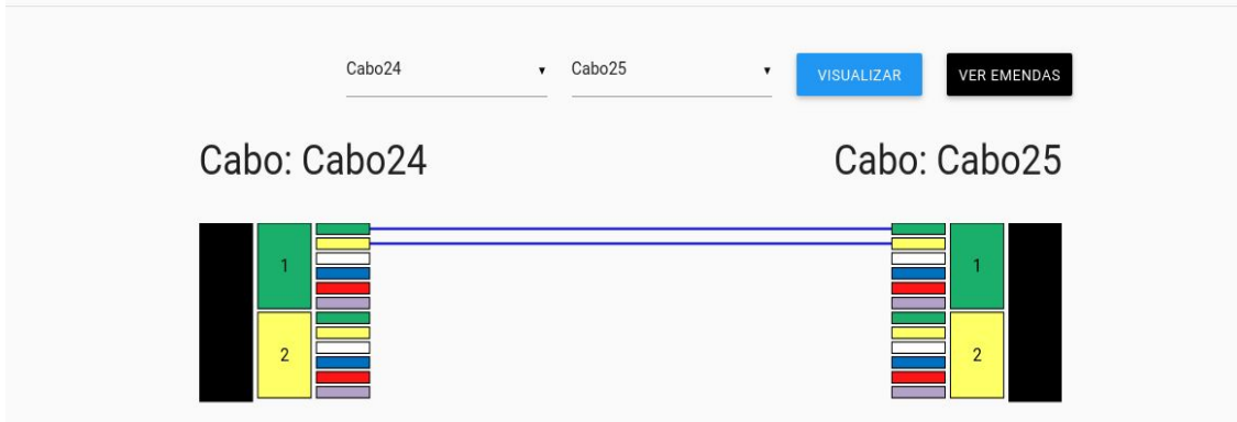
Figura 2: Tela de gerenciamento de emendas do protótipo do GIRO

Ao fim da fase piloto, o sistema também deverá gerenciar o acesso de usuários com diferentes perfis, permitir o uso em dispositivos móveis e gerar relatórios para apoiar tarefas de gestão, reparo e expansão das redes.